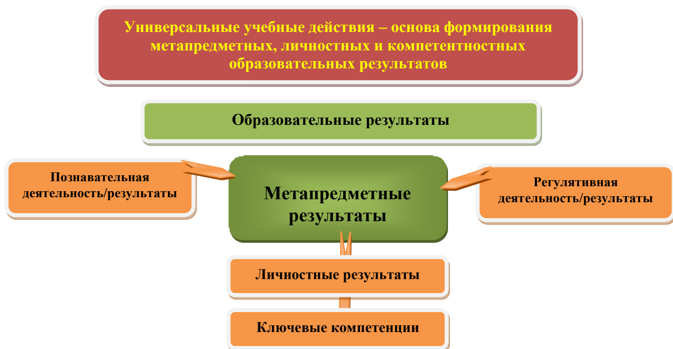
Рис. 3. Система оценки образовательных результатов

Система оценки предусматривает уровневый подход к представлению планируемых результатов и инструментарию для оценки их достижения. Согласно этому подходу за точку отсчёта принимается не «идеальный образец», отсчитывая от которого «методом вычитания» и фиксируя допущенные ошибки и недочёты, формируется сегодня оценка ученика, а необходимый для продолжения образования и реально достигаемый большинством учащихся опорный уровень образовательных достижений. Достижение этого опорного уровня интерпретируется как безусловный учебный успех ребёнка, как исполнение им требований Стандарта. А оценка индивидуальных образовательных достижений ведётся «методом сложения», при котором фиксируется достижение опорного уровня и его превышение. Это позволяет поощрять продвижения учащихся, выстраивать индивидуальные траектории движения с учётом зоны ближайшего развития.