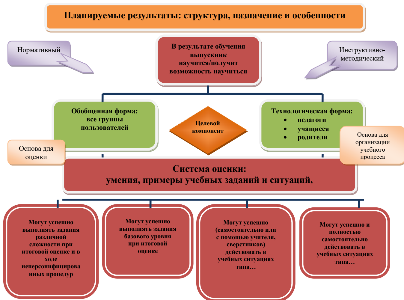
Рис. 1. Особенности структуры планируемых результатов. Функция и назначение.

Система оценки достижения планируемых результатов освоения основной образовательной программы основного общего образования (далее – система оценки) представляет собой один из инструментов реализации требований Стандарта к результатам освоения основной образовательной программы основного общего образования, направленный на обеспечение качества образования, что предполагает вовлечённость в оценочную деятельность как педагогов, так и обучающихся (рис. 1).